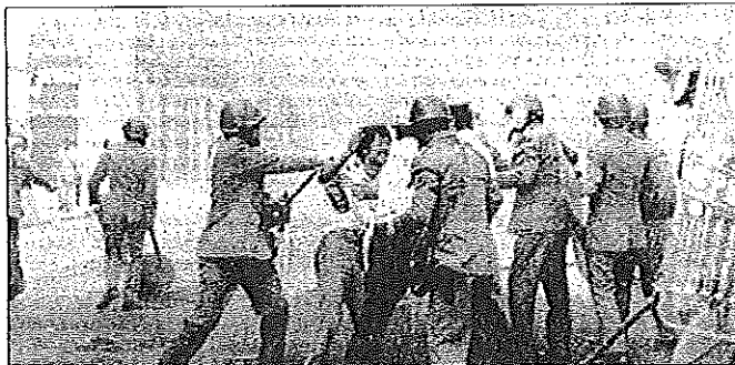
I moti di Reggio Calabria

Promosso dall'Associazione Culturale Anassilaos, con il patrocinio del Comitato per le Celebrazioni del 50° Anniversario della "Rivolta di Reggio Calabria", e realizzato da Giacomo Marciàno, sarà disponibile da lunedì 13 luglio sul sito facebook di Anassilaos e su You Tube il video realizzato da Giacomo Marciàno che vuole essere un omaggio ai Caduti e a tutti coloro che nel corso degli eventi che hanno investito la Città dal 14 luglio 1970 in poi hanno riportato ferite fisiche e morali incancellabili. Per la realizzazione del video sono state utilizzate immagini di Agazio Trombetta, Giuseppe Diaco, Mario di Pietro e Aldo Fiorenza mentre i testi cartacei prodotti nel corso della Rivolta (giornali, manifesti, locandine ed altro materiale) sono tratti dal volume, Città del Sole edizioni, di Franco Arcidiaco e Daniela Pellicano