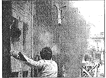
La Rivolta di Reggio Calabria