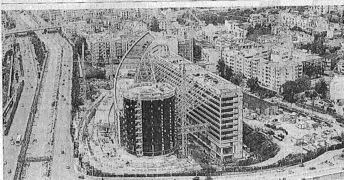
Incompiuta La grande opera del nuovo Tribunale aspetta da anni ormai di essere consegnata agli uffici giudiziari

mento dell'ormai tradizionale sistema del pagamento delle prestazioni farmaceutiche sanitarie (nonon tempestiva erogazione dei fi parte del Sistema Sanitario N le)». In questo quadro già de emerge che «tra i motivi del ri è oggi anche la disorganizzaz tema dell'Asp che non è in g gestire, organizzare e formar prio personale, dichiaratam capace ad effettuare i strutt redazione dei documenti o predisposti»... per non essere dizione di poter utilizzare la dura informatica dell'AS 400. quidazione delle farmacie i zionate esterne, in quanto