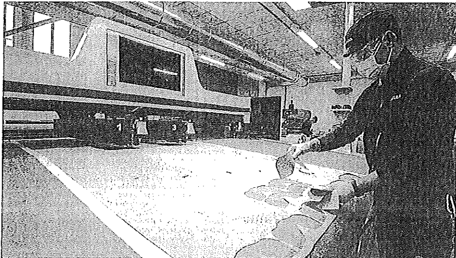
Economia "sospesa": il lockdown ha bloccato per mesi l'attività della maggior parte delle imprese calabresi con pesanti ripercussioni