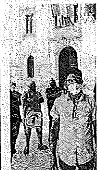
Sciopero Uno degli ultimi dei dipendenti Avr davanti