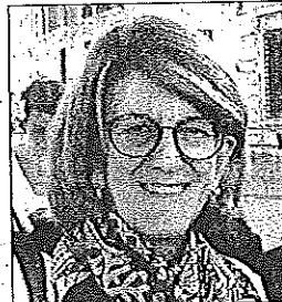
La deputata 5 Stelle Barbutto

CATANZARO - La deputata M5S Elisabetta Barbutto invia a tutti i colleghi deputati e senatori calabresi, di qualunque schieramento, la richiesta per la costituzione di un intergruppo per il rilancio delle infrastrutture della Costa Jonica. «Strade, ferrovia, aeroporto - scrive - che dovrebbero essere il volano di sviluppo delle nostre zone, sono perennemente e sistematicamente ignorate da seri e costruttivi interventi che riconoscano ai cittadini calabresi della fascia jonica, analogamente a quanto accade per tutti i cittadini italiani: il diritto ad una mobilità sicura e adeguatamente rapida verso tutte le zone del nostro paese. Il diritto di scegliere con quale mezzo di trasporto spostarsi sul territorio. Il diritto di vedere risorgere la fascia jonica sotto il profilo economico consentendo appieno lo sviluppo delle attività