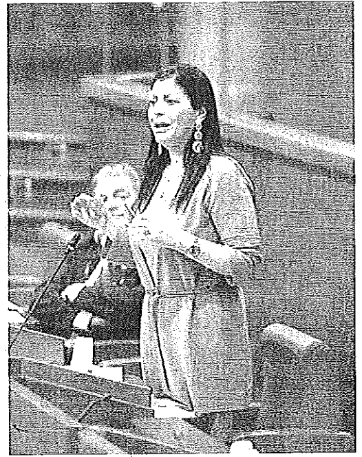
Il presidente della Regione Jole Santelli

bili, peraltro sin qui non sempre per intero ed attentamente utilizzate». Da qui la scelta unanime di adoperarsi per rendere operativi quanto prima i tre strumenti istituzionali deputati - come da specifico piano regionale - alla lotta alla povertà. Nell'ordine: la cabina di regia, il tavolo tecnico della rete regionale e la task force.