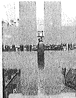
Asp Bloccati da mesi i pagamenti per le farmacie

Una situazione purtroppo non inedita, visto che da diversi anni ormai l'Asp, nonostante «il commissariamento ed il (presunto) ripristino dei principi di "legalità" anche ai fini contabili ed amministrativi - violati sistematicamente i propri obblighi di