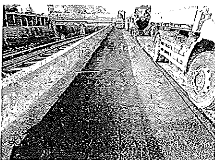
L'operazione È stata riqualificata l'arteria spesso usata come discarica