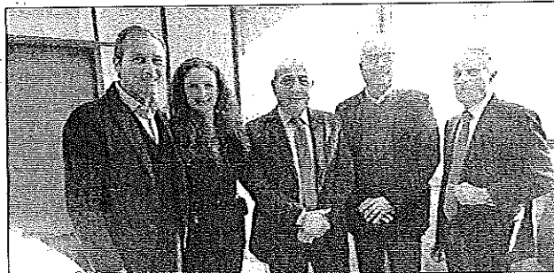
Un momento dell'incontro

Auspicio possa essere per ciascuno di loro e per altri che seguiranno, futuri protagonisti di una classe dirigente in