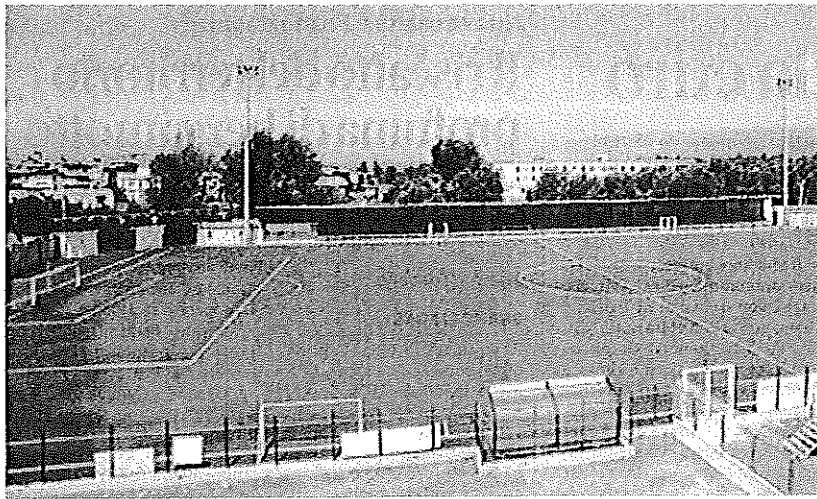
"Giovanni Paolo II" Una veduta dello stadio rosarnese

Rosarno, la giunta destina oltre un milione di euro con i mutui