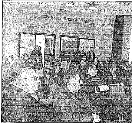
L'animata assemblea alla Metrocity