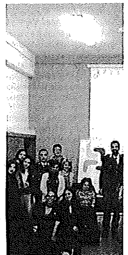
Liceo "Rechichi" Foto di grup

Al centro polifunzionale Padre Puglisi l'incontro "L'Amore non lascia lividi"