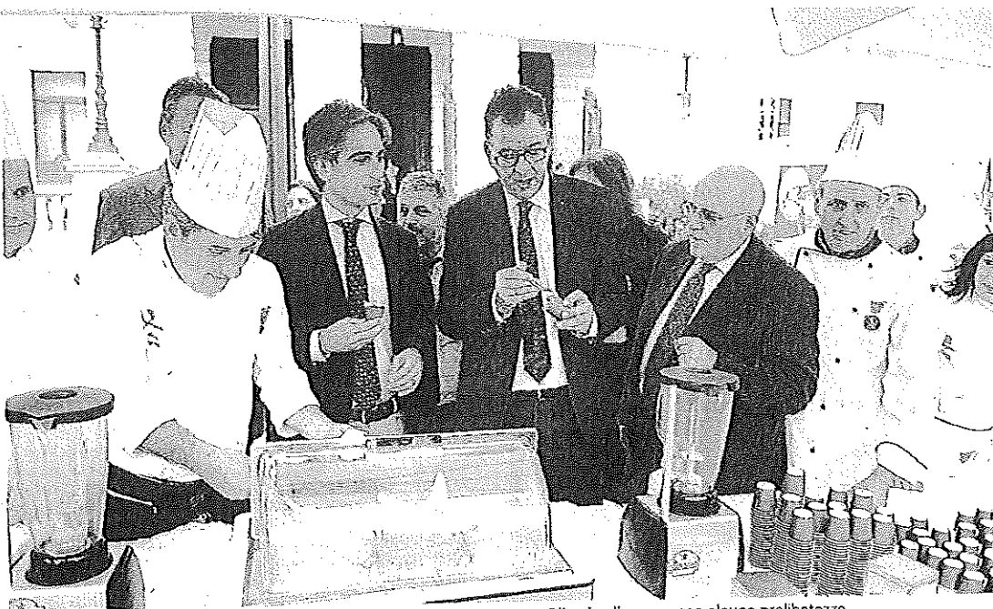
Presi per la gola... Il sindaco Falcomatà, il ministro Mueller e il Governatore Oliverio alle prese con alcune prelibatezze

Anche quest'anno te ragazzi, dagli 11 ai 13 e quentanti le scuole secondo primo grado della città il compito di dare un concreto e diretto alla pienza e alla salvaguardia cultura della democrazia, dilità e della partecipazione alla vita della comunità. Durante la seduta si