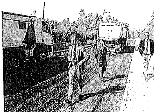
Avanti tutta Gli interventi di bitumazione delle strade a Pentimele

Via Travia e via Vassallo, nel quartiere di Pentimele, pronte. E poi ancora Gallico e poi via verso Catona, senza dimenticare i passaggi complementari per la zona di Santa Caterina dove doveva essere completata la posa della segnaletica orizzontale (i tempi sono slittati in avanti anche a causa del maltempo). Questi i nuovi aggiornamenti del cantiere che sembra essere un fulmine, vale a dire quello relativo alla scarifica e bitumazione delle strade a Nord della città, realizzato dall'Anas. Il