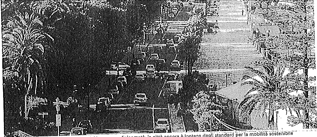
Molte auto e non euro 6 Una veduta del lungomare Falcomata: la città ancora è lontana dagli standard per la mobilità sostenibile

La città si conferma poco propensa a orientarsi verso la mobilità sostenibile