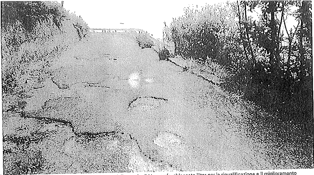
"Percorso di guerra". Ecco come si presenta una delle strade di Mosorrofa: sbloccato l'iter per la riqualificazione e il miglioramento

La Metro City ha assegnato il primo dei tre lotti per sistemare le arterie