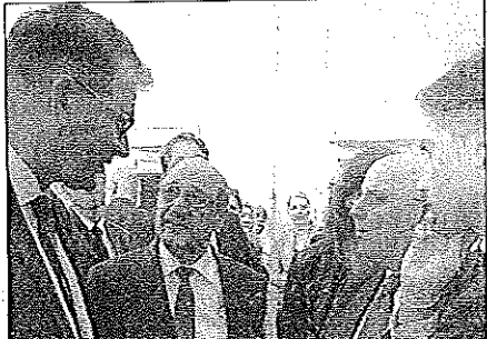
Müller, Schulz, Oliverio e Fatcomatà

REGGIO CALABRIA - «Reggio ha una posizione strategica al centro del Mediterraneo. Oggi parlerò di un'utopia che è connessa anche a questa città. Della globalizzazione del turismo, che guarda allo sviluppo anche nei paesi in via di sviluppo». Lo ha affermato ieri l'ex presidente del Parlamento Europeo e attuale deputato del Bundestag tedesco Martin Schulz intervenendo a Reggio Calabria al convegno, all'interno della riunione annuale della Deutscher Reiseverband (Drv), sul tema "Pensa globale! Il turismo come motore di uno sviluppo sostenibile", al quale partecipa anche il Governatore della Calabria Mario Oliverio.